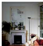
Travaux de peintures, papiers-peints et pose de tentures